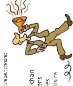
(Δ) Une chape de béton fraîchement mise en œuvre peut « rendre » son eau de gâchage pendant plusieurs mois.

Les travaux à risque (pour la santé et la sécurité) devraient être réalisés en l'absence des enfants (et des femmes enceintes) , profitant, par exemple, d'un séjour chez leurs grands-parents.